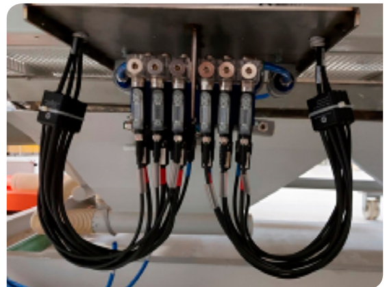
THE DEVICE ITSELF